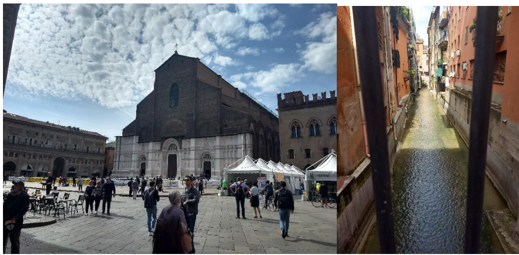
Alcuni scorci tra piazza Maggiore e il canale che percorre sotto bologna