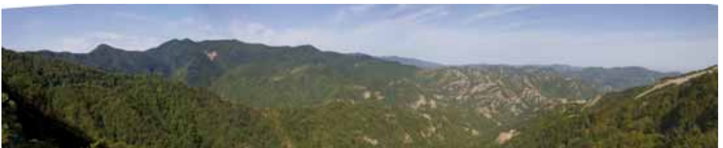
Vista da Poggiaccio—Nocicchio